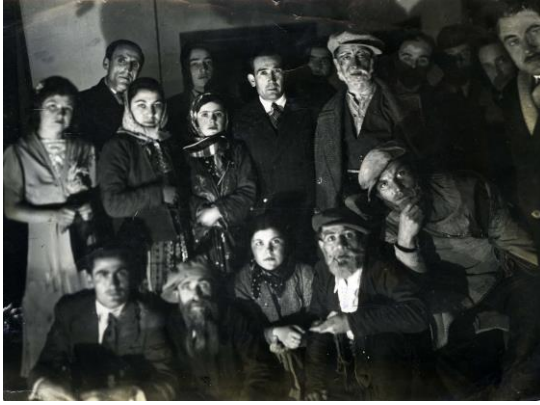
(1939.12.15 Taş Parçası piyesi,)

Derginin 1. sayısında halkevinin bir faaliyeti olarak, on beş günde bir öğretmenler arasında çaylı ve danslı toplantılar düzenlenmiştir. İlk toplantı Lise tarafından yapılmış ve geç saatlere kadar eğlenilmiştir. Bu toplantıların ise ders yılı sona erene kadar gerçekleştirileceği duyurulmuştur.