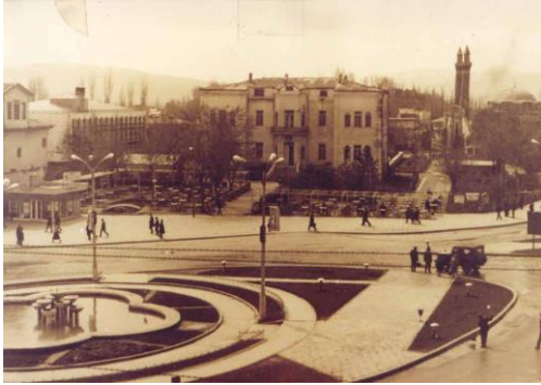
(Hükümet Meydanı, Ahmet Göze arşivi.)

Eylül dergisi 30 Ağustos 1941'de çıkan 30. sayıdan sonra bir ay duraklamaya girmiştir. Dergi, 30 Son Teşrin (Kasım) 1941'de çıkan 32. sayıdan sonra iki aylık bir duraklamaya gitmiştir. Bunun üzerine 33. sayı 28 Şubat 1942'de çıkmıştır. 33. sayıda 'Haberler-Çalışmalar' bölümünde bu konu hakkında şu ifadeler yer alır. "Dergimiz bazı ciddi sebepler dolayısıyla neşriyatını aksatmıştır. Bu yüzden birinci ve ikinci Kânun sayılarımızı çıkaramadık. Aradaki bu iki aylık açığı kapamamıza imkân yoktur. Sayın okurlarımızdan özür diler; bu sayımızı üç sayı karşılığı tutmalarını rica ederiz" (İmzasız, 28 Şubat 1942: 15-AKİ).