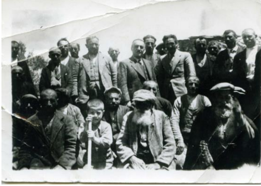
(1941 Karaçayır'da 5. kol ve paraşütcüler hakkında.)

Derginin 29. sayısında Spor Şubesinin 13 Temmuz Pazar günü yüzme müsabakaları tertip ettiği bilgisine ulaşılır.