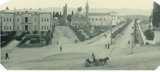
(Hükümet Meydanı,).