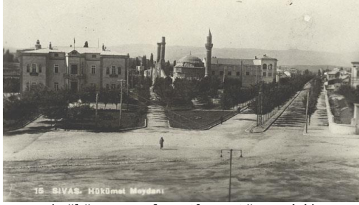
(Hükümet Meydanı)

Dergide, Sivas'ın kültürü, coğrafyası ve tarihi hakkında geniş bilgilere yer verilmiştir. İbrahim Olçaytu'nun, "Sivas Lisesinin Yapılış Tarihi", Vehbi Cem Aşkun'un, "Sivas'ın Tarihçesi" başlıklı ilk üç sayıda yer alan yazısı ve 4 Eylül'ün on sayısında çıkan "Sivas Folkloru" başlıklı yazısı bunlardandır. "Sivas Folkloru" başlıklı yazısında kız isteme ve düğün merasimi geniş bir şekilde anlatılmıştır.