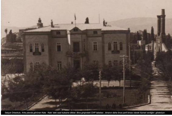
(Selçuk Ortaokulu, Sivas Belediyesi arşivi Sefa Sarı.)

Derginin 24. sayısında Behram Altay'ın “Nurullah Ataç Üstadımız Sivas Halkevinde” adlı makalesi bulunmaktadır. Makale, Nurullah Ataç'ın Divan edebiyatı, Tanzimat ve Servet-i Fünûn edebiyatı üzerine değerlendirmelerini içermektedir. Derginin 25. sayısında Behram Altay'ın “Sivas Folkloru ve Vehbi Cem Aşkun” adlı bir diğer makalesi bulunmaktadır. Behram Altay bu makalede ise Sivas'ın folklor bakımından zenginliği ile Vehbi Cem Aşkun'un Sivas Folklorü adlı kitabı üzerinde durur. Derginin 34. sayısında yer alan “Yedinci Kitap” adlı makale ise yine Behram Altay imzalı olup, Feyzi Kutlu Kalkancı'nın Dünden Bugüne adlı şiir kitabı hakkındadır. Derginin 16. sayısında yer alan “Muallim Mektebi” adlı yazı ise Behram Lutfi'nin Deli Mektebi adlı eserinden parçalara yer verir. Eflatun Cem Güney'in “Âşık Meslekî'nin İlk Değişleri” adlı makalesi ise derginin 13. sayısında yer almaktadır. Makalede Âşık Meslekî'nin şiirleri üzerine bir inceleme yapılır.