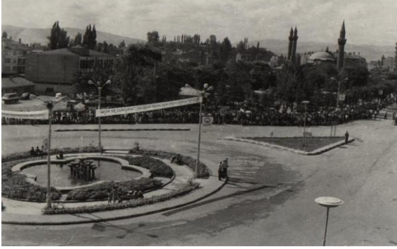
(Hükümet Meydanı, Sivas Belediyesi arşivi Sefa Sarı.)

“Reisicumhurumuz ve Milli Şef İsmet İnönü’nün Cumhuriyetimizin 16’ıncı Yıl Dönümünde Türk Milletine Hitapları” adlı söylev de derginin 9. sayısında yer almaktadır. Metin, Türk milletinin birlik, beraberlik ve vatan müdafaasında gösterdiği mücadeleyi gelecek yılda da sürdürmek için dikkatli olunmasını konu edinir.