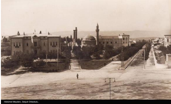
(Selçuk Ortaokulu,)